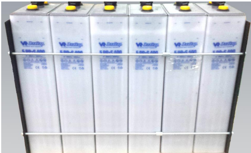
Rack de sujeción único