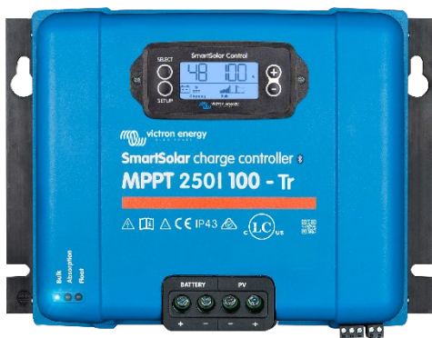
Controlador de carga SmartSolar MPPT 250/100-Tr Con pantalla conectable opcional.