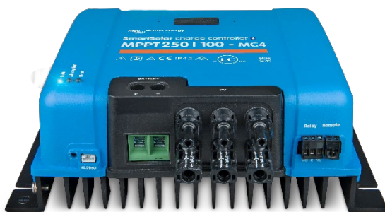
Controlador de carga SmartSolar MPPT 250/100-MC4 Sin pantalla