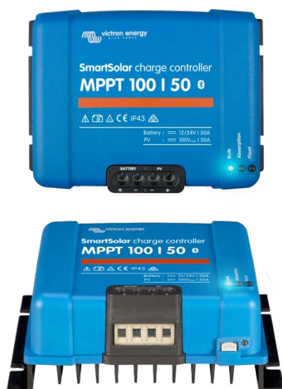
Controlador de carga SmartSolar MPPT 100/50

- Smartphones, tabletas y otros dispositivos Apple y Android - Panel ColorControl.